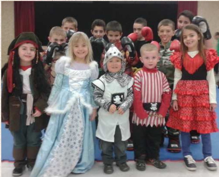
Les enfants et jeunes étaient invités à venir s'entraîner déguisés.

Après les vacances, les enfants et jeunes de l'association Full & Light étaient invités à venir s'entraîner déguisés. L'occasion pour ce petit monde de fêter Mardi gras sportivement ! Ravis, ils assuraient aussi ce soir-là, le rôle de professeur à tour de rôle. Après l'entraînement, adhérents et familles se retrouvaient autour de crêpes, gaufres et bonbons. La semaine prochaine, les adhérents du club d'Heyrieux feront le déplacement pour partager le cours des Charantonnois, avant l'interclubs régional au Bourget du Lac, où l'association devrait présenter une dizaine de compétiteurs en light contact.