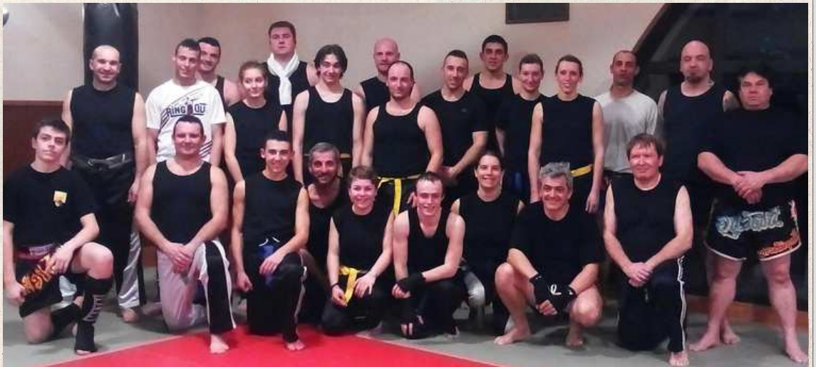
L'association Full & Light a reçu les adhérents de la Team Fernandez d'Heyrieux pour un entraînement commun, en toute amitié.

Les ados-adultes s'entraînaient ensemble aux techniques du club local ou au full-contact (pieds et poings au-dessus de la ceinture). Ils finissaient aussi par quelques assauts, au plus grand bonheur des adhérents de Charantonnay qui confirmaient un niveau et une condition physique supérieure. Cette soirée se finissait dans la convivialité.