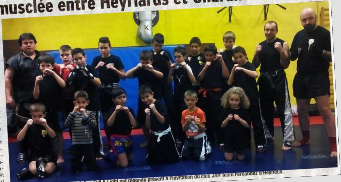
Quelques adhérents de l'association Full & Light ont répondu présent à l'invitation du club JAH Team Fernandez d'Heyrieux.

L'échange était satisfaisant des deux côtés, et les pratiquants Heyriards se rendront en 2015 à l'aire ouverte pour un autre échange. Toujours dans l'intérêt des pratiquants, qu'ils soient compétiteurs ou loisirs.