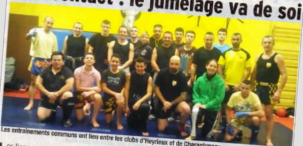
Les entraînements communs ont lieu entre les clubs d'Heyrieux et de Charantonnoy.

Les liens entre les différents clubs de full-contact du secteur sont très prononcés. Alors il n'est pas rare que les clubs se donnent rendez-vous pour des entraînements communs. C'est ainsi que les