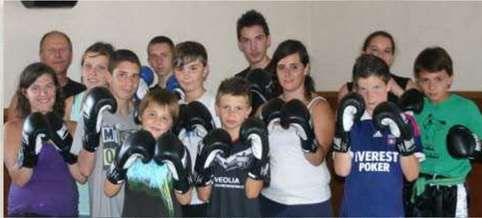
Des jeunes du service jeunesse de la CCCND ont participé à un cours de boxe, mardi.

L'association Full and Light a proposé deux cours d'initiations à la boxe. Le premier s'est déroulé mardi et le second a lieu aujourd'hui.