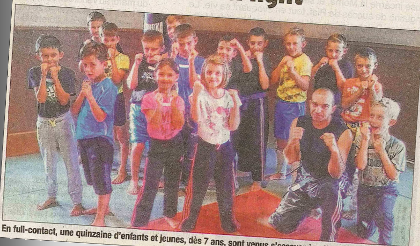
En full-contact, une quinzaine d'enfants et jeunes, dès 7 ans, sont venus s'essayer à cette discipline.

L'association Full & light débutait officiellement ses cours cette semaine, en proposant six séances hebdomadaires. En full-contact, une quinzaine d'enfants et jeunes, dès 7 ans, venaient s'essayer à cette discipline et ainsi compléter le groupe d'adhérents fidèles depuis plusieurs saisons.