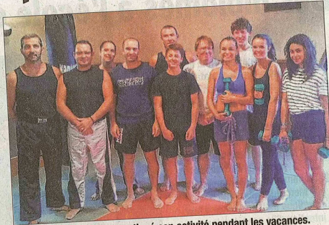
Le club Full and light a continué son activité pendant les vacances. Samedi prochain, il participera au Forum des associations.

L'association est restée active, en proposant deux cours libres par semaine en juillet et en août. Chaque adhérent pouvait venir s'entraîner en full-contact ou faire des exercices de préparation physique générale dans la bonne humeur. Les vacanciers de juillet ont remplacé les aoûtins, et chaque cours réunissait quelques sportifs. Depuis cette semaine, la reprise se fait sentir et les effectifs augmentent régulièrement, avec la réouverture officielle de l'association, lundi 7 septembre, qui proposera cette saison, deux cours enfants-jeunes, deux cours ados-adultes et deux cours de préparation physique ouvert à tous. L'association participera au forum des associations de la commu-