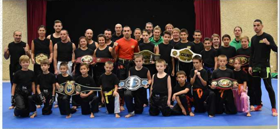
Le stage organisé par Full & Light a permis aux pratiquants de côtoyer le haut niveau.

cours axé kickboxing et K-1 était proposé l'après-midi à tous les combattants de la région : au programme, coup de genoux, low-kick et principalement des techniques défensives. Ce cours regroupait plus d'une vingtaine de pratiquants issus du full-contact, Kickboxing et K-1 mais aussi du taekwondo, de la boxe anglaise et du Sanda. Après un nouveau moment d'autographes et de photos, l'après-midi se finissait autour d'une petite collation, avant leur départ en direction du sud.