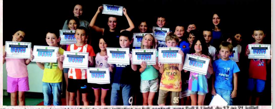
Les 42 enfants présents à Trucolliers de Charantonnay-Saint-Georges d'Espéranche ont également bénéficié de cette initiation au full-contact, avec Full & Light, du 17 au 21 juillet.