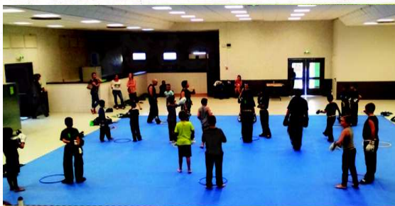
Cette première semaine de reprise chez Full & Light a rencontré un vrai succès. Les nouveaux inscrits s'essayaient dans les divers cours.

Plus de 70 % des adhérents de la saison dernière s'étaient déjà inscrits pendant l'été. Cette première semaine de cours a rencontré un vrai succès. Les anciens adhérents étaient déjà présents et les nouveaux qui avaient pris contact avec le club durant l'été s'essayaient aux six cours hebdomadaires proposés : full-contact, boxe pieds poings, enfants jeunes (7-12 ans), les mardis et jeudi. Ados adultes (plus de 13