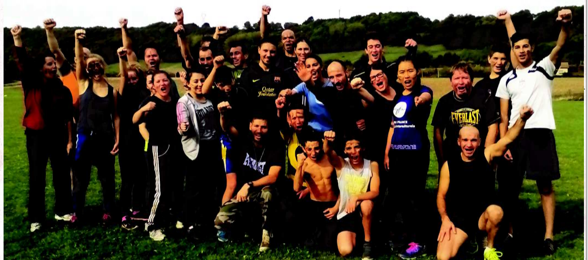
Les Spartiates et les Kamaté se sont livrés bataille au cours d'un boot camp. L'objectif étant de faire du sport et d'améliorer la cohésion de groupe.

Comme il y a deux ans, l'association Full & Light mandatait dimanche matin OTC Boot Camp de Chambéry, pour faire du sport et de la cohésion dimanche matin au stade des Grandes bruyères de Charantonay. Une trentaine de participants, adhérents, familles, et amis, se retrouvaient dès 9h30 pour un petit échauffement en équipe. Après quoi, tous les jeux et ateliers sportifs opposaient les deux équipes : les Spartiates contre les Kamaté. Une matinée appréciée de tous les participants, qui n'ont pas vu les deux heures passer. Celle-ci se finissait par le verre de l'amitié avec conjoints et enfants dans une belle ambiance.